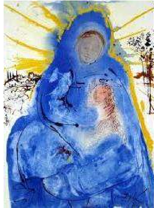
S. Dali: Djevica će roditi sina