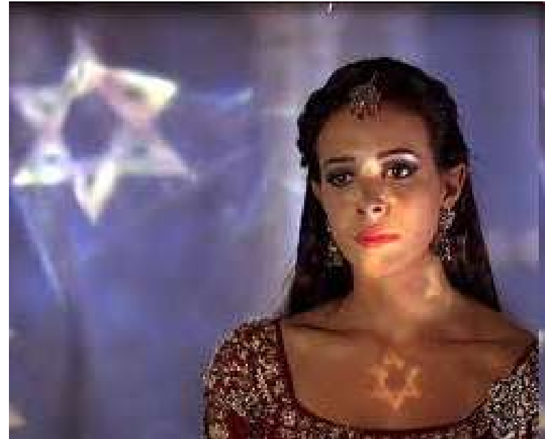
Tiffany Dupont u filmu: One Night with the King (2006.)