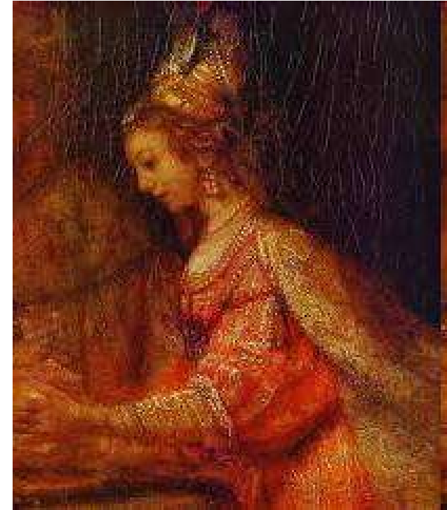
Detalj Rembrandtova djela: 'Ahasver, Haman i Estera'