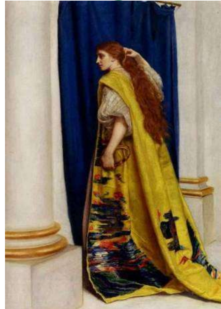
Sir John Everett Millais (1829-96)