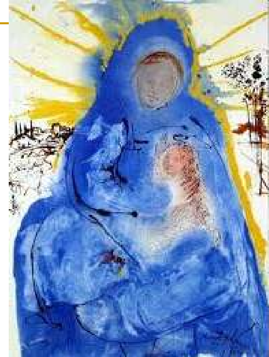
S. Dali: Djevica će roditi sina