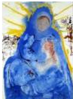
S. Dali: Djevica će roditi sina