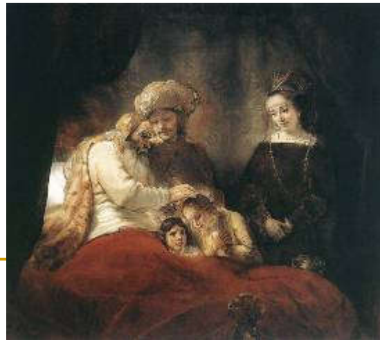
Matthias Scheits, Jakov blagoslivlja sinove, 1672.