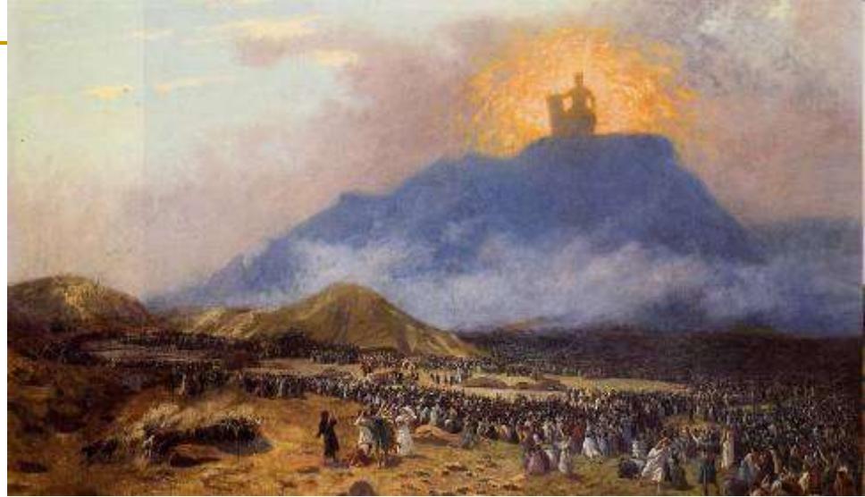
Jean-Léon Gérôme, Mojsije na gori Sinaju (1895-1900)