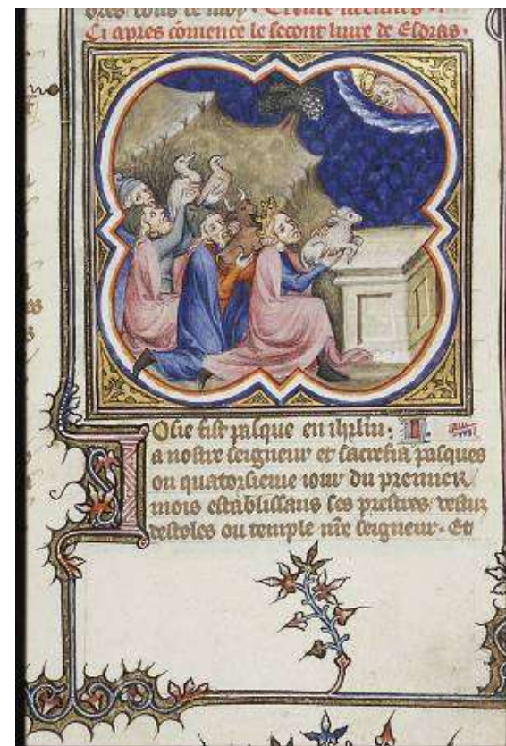
Minijatura, Petrus Comestor, Bible Historiale, Francuska, 1372