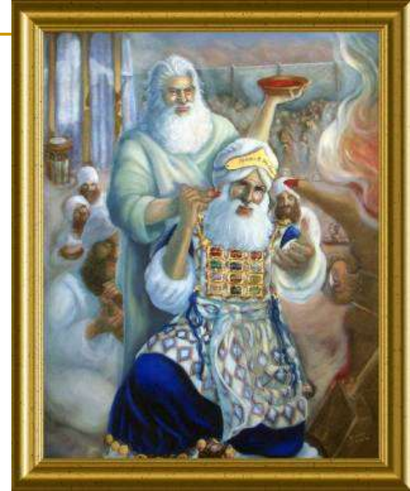
Darlene Slavujac, Mojsije posvećuje Arona, ulje na platnu, 1994.