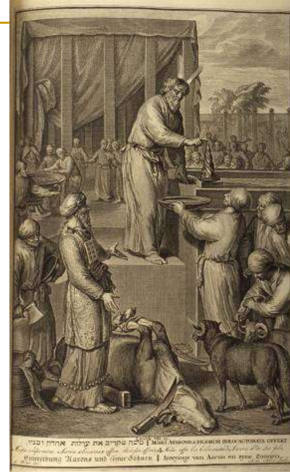
G. Hoet, A. de Blois, “Figures de la Bible”, Haag 1728