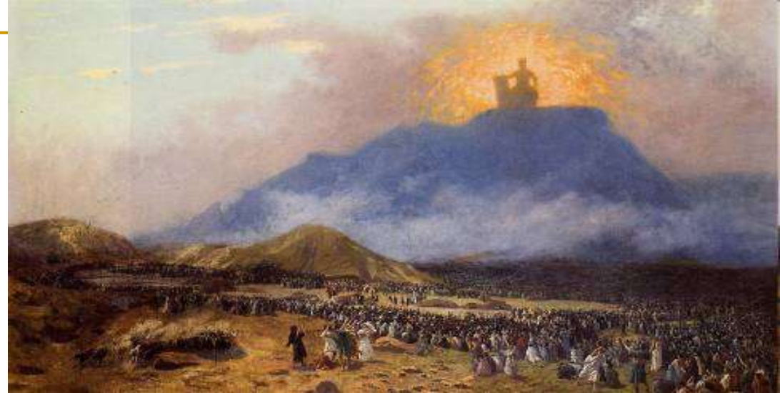
Jean-Léon Gérôme, Mojsije na gori Sinaju (1895-1900)