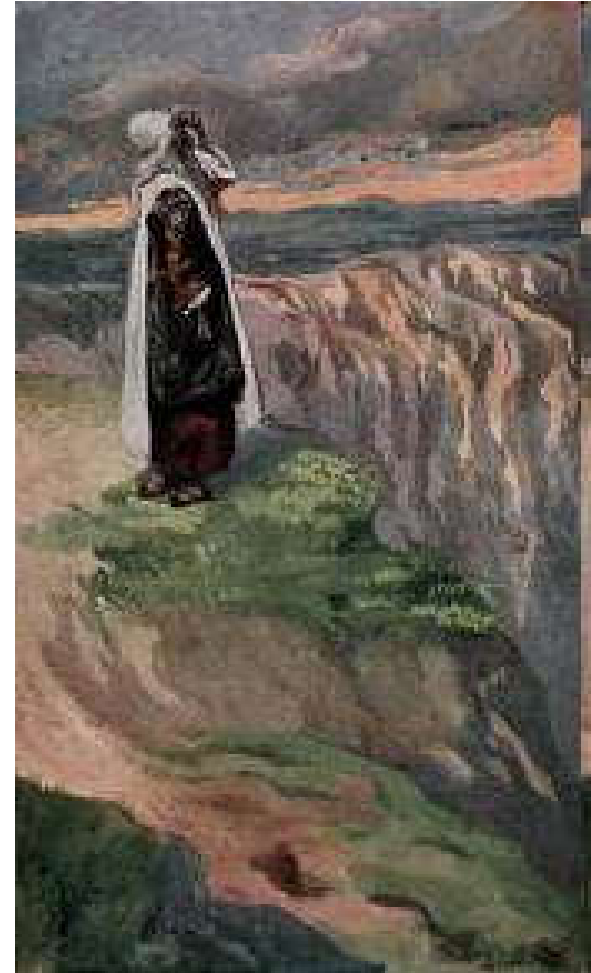
James Tissot, Mojsije gleda obećanu zemlju (akvarel, 1896.-1902.)