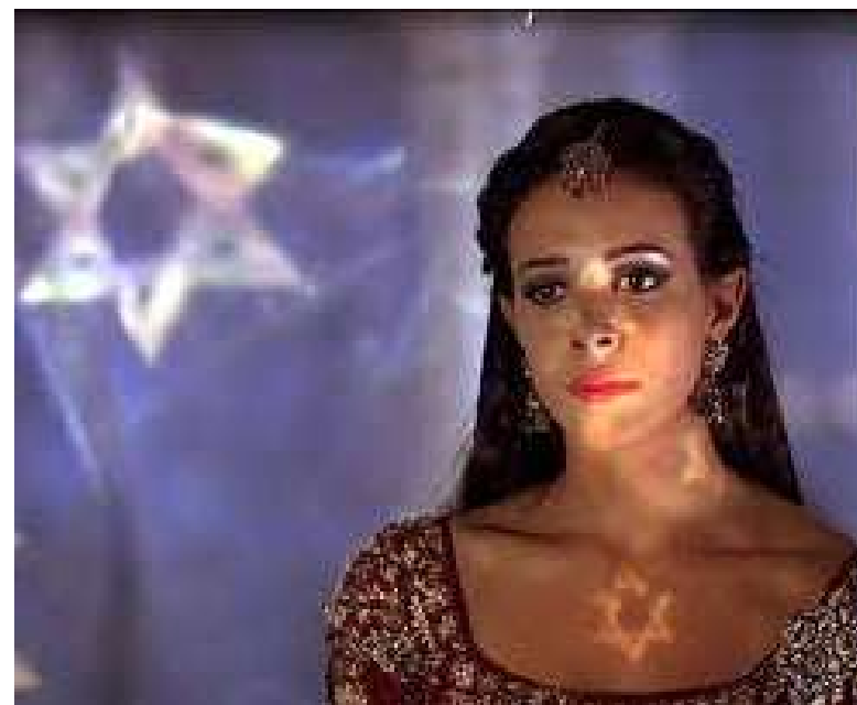
Tiffany Dupont u filmu: One Night with the King (2006.)