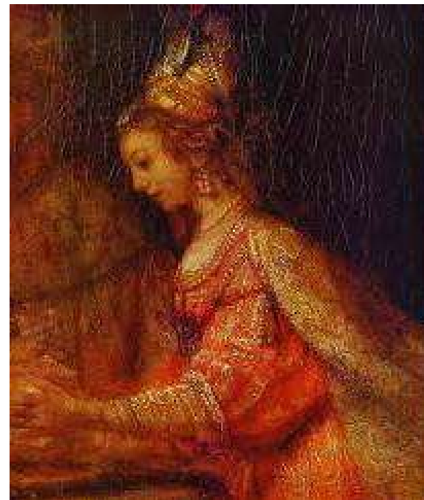
Detalj Rembrandtova djela: 'Ahasver, Haman i Estera'