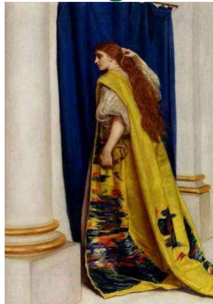
Sir John Everett Millais (1829-96)