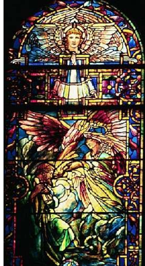
The call of Isaiah, Union Congregational Church Montclair, Tiffany Studios