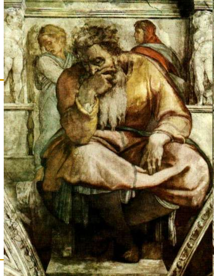
Michelangelo, Jeremija, Sikstinska kapelica