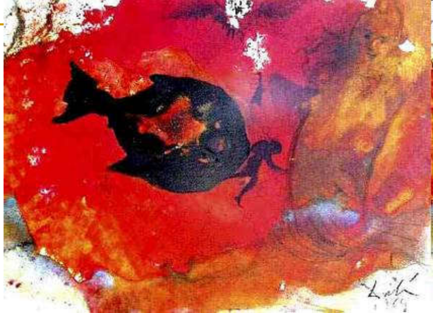
S. Dali, Jona u ribljoj utrobi, Sacra Biblia 1964-1967