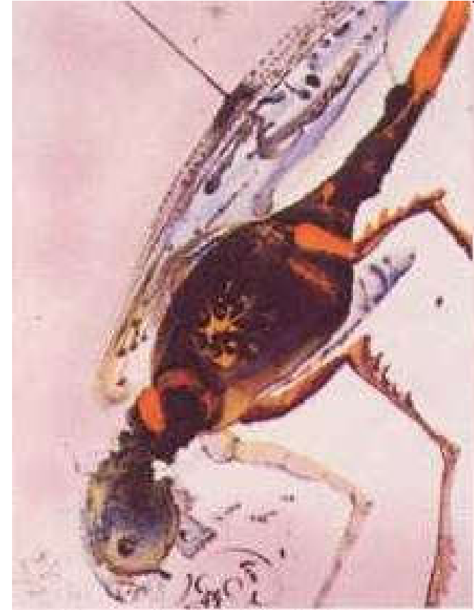
S. Dalí, Locusta et bruchus, Biblia Sacra 1964-67