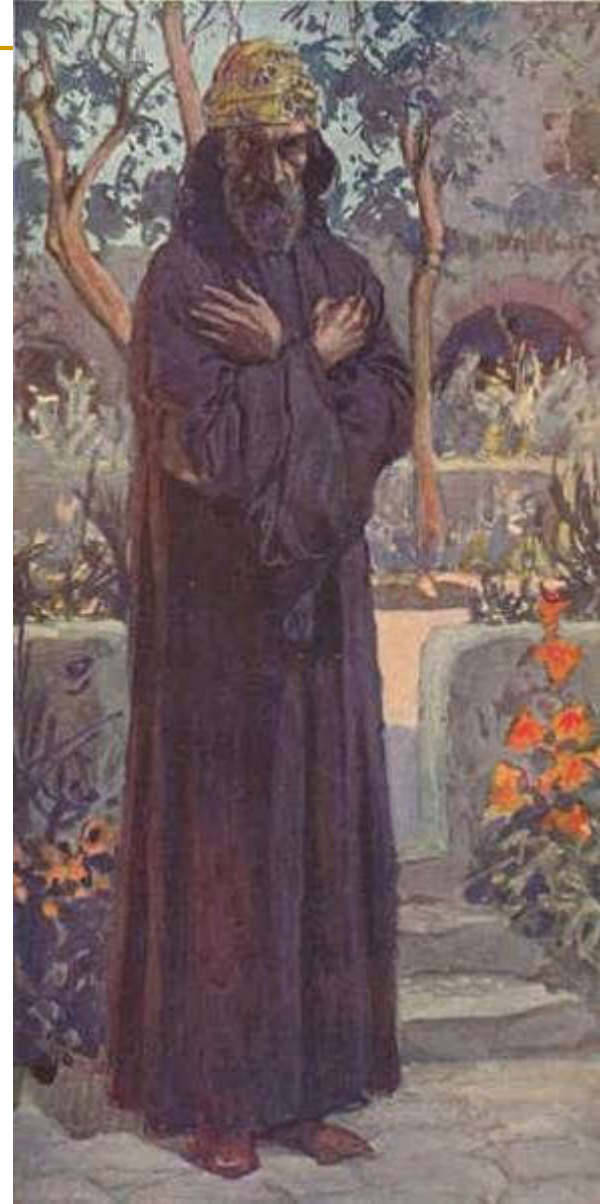
James Tissot, Prorok Joel