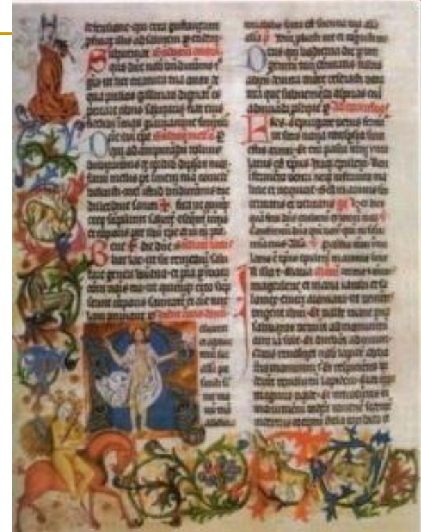
Svečana Biblija zagrebačke katedrale, XIV. st.