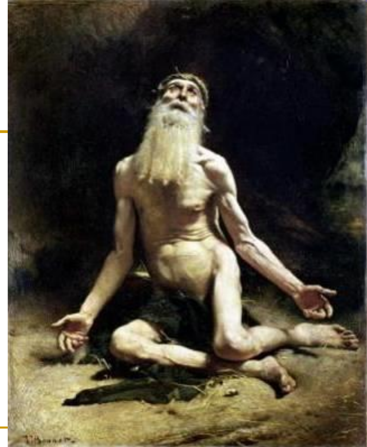
Leon Bonnat, Job The Lilith Gallery of Toronto