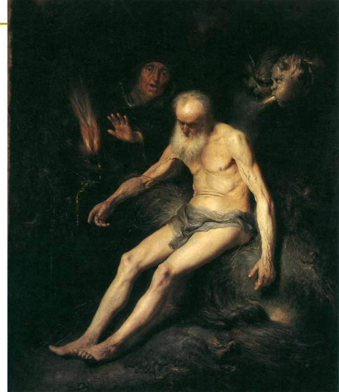
Jan Lievens, Job on the Dunghill, 1631