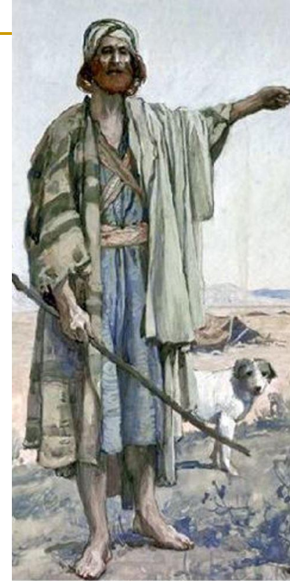
Amos by James Tissot