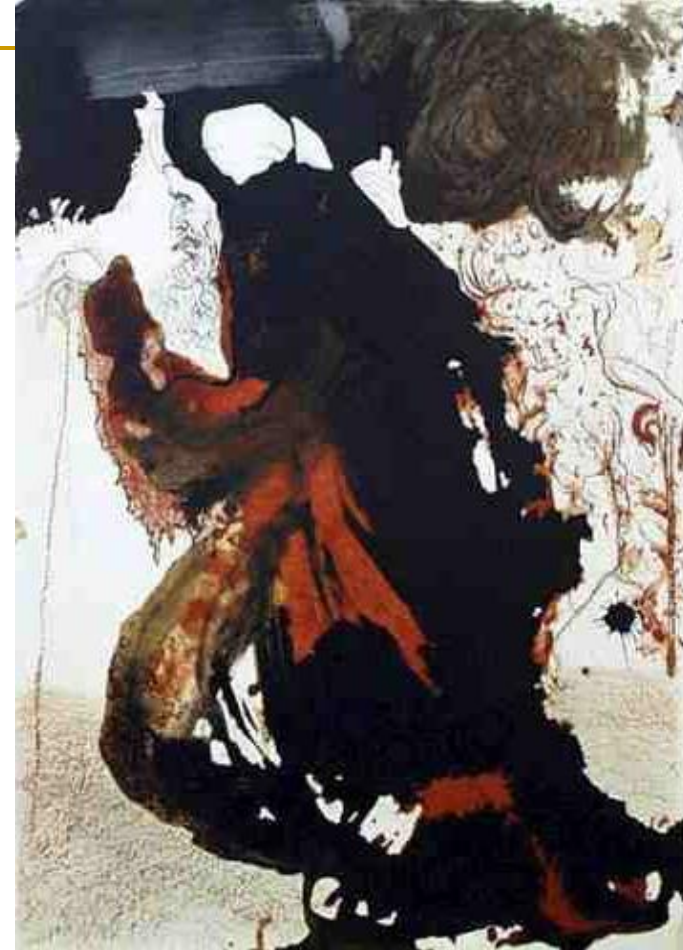
S. Dalí, Am 7,7: U ruci mu visak, "Biblia Sacra", 1969 by Rizzoli of Rome