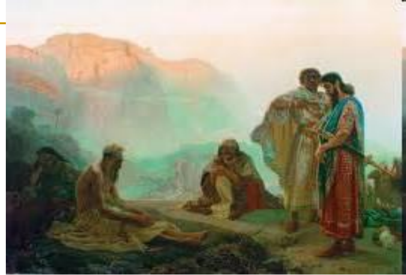
Ilya Repin. Job i prijatelji 1869. Ulje na platnu. The Russian Museum, St. Petersburg