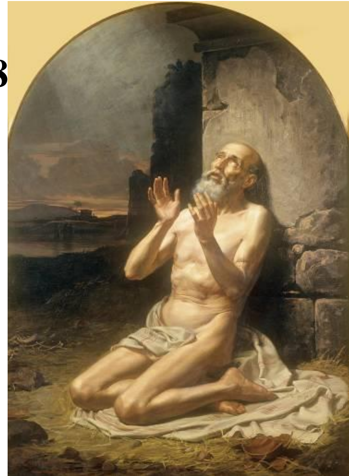
Gonzalo Carrasco, Job on the Dunghill. Oil on canvas, 1881. Museo Nacional