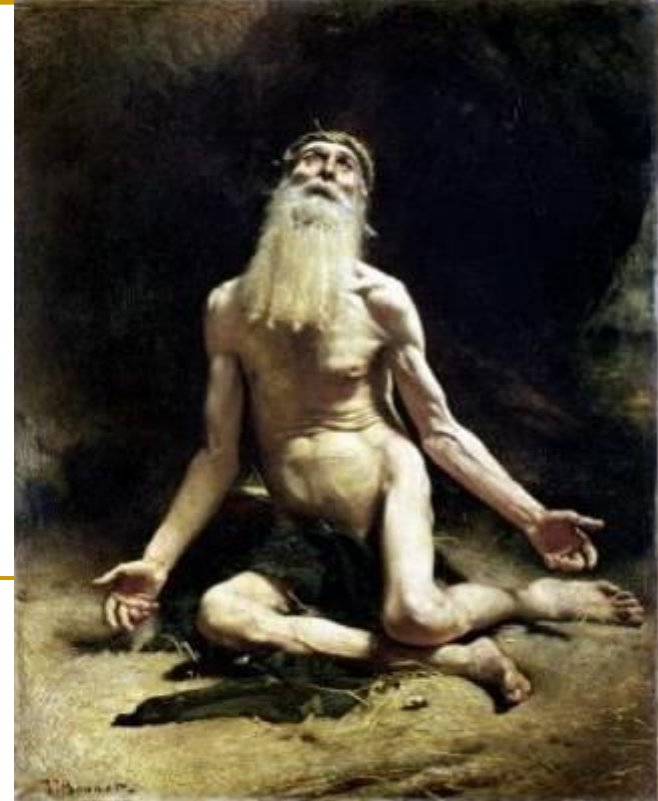
Leon Bonnat, Job The Lilith Gallery of Toronto

Pravednik-patnik u potrazi za Božjim odgovorom