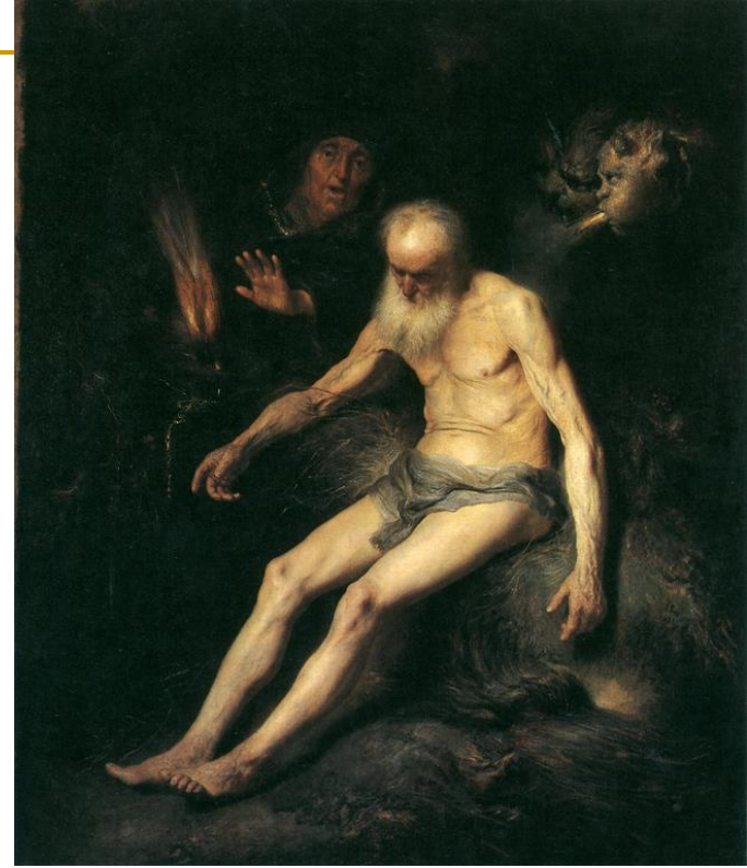
Jan Lievens, Job on the Dunghill, 1631