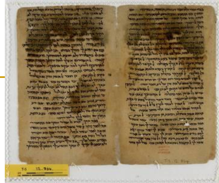
Odlomak na hebr. Sir 5,10–7,29; 11,34–14,11 u Cambridgeu