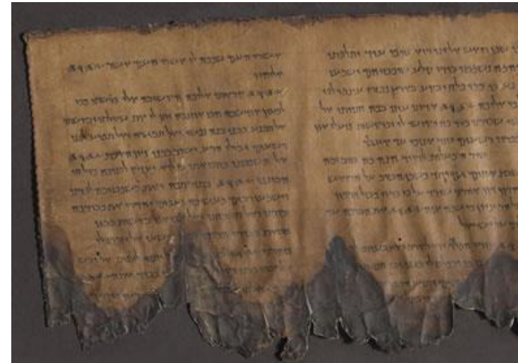
Svitak psalama, Kumran (11Q5)

■ Hvalospjev (himan), zahvalnica ↔ tužaljke