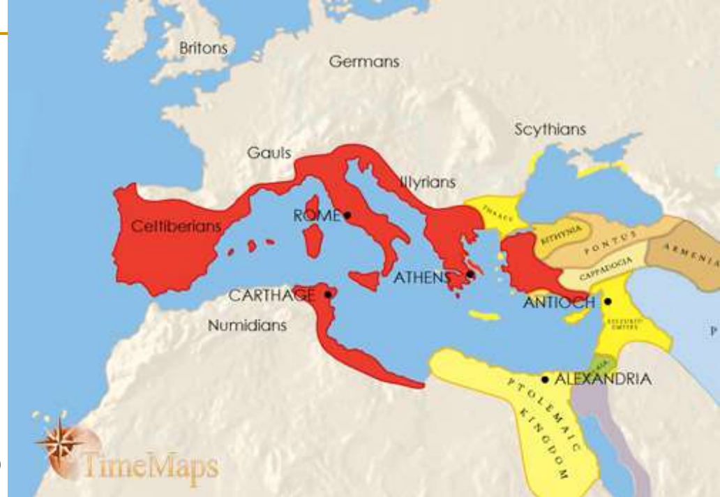
Rimsko carstvo 200. – 100. pr. Kr