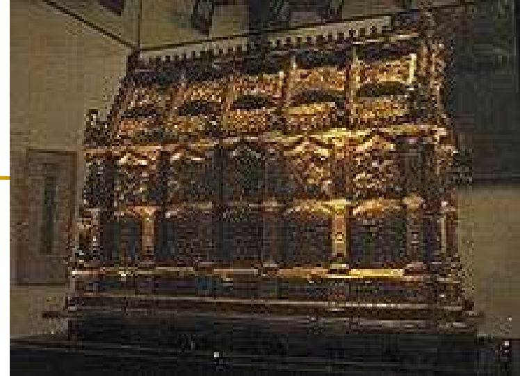
Relikvije Makabejaca u crkvi Sv. Andrije u Kölnu