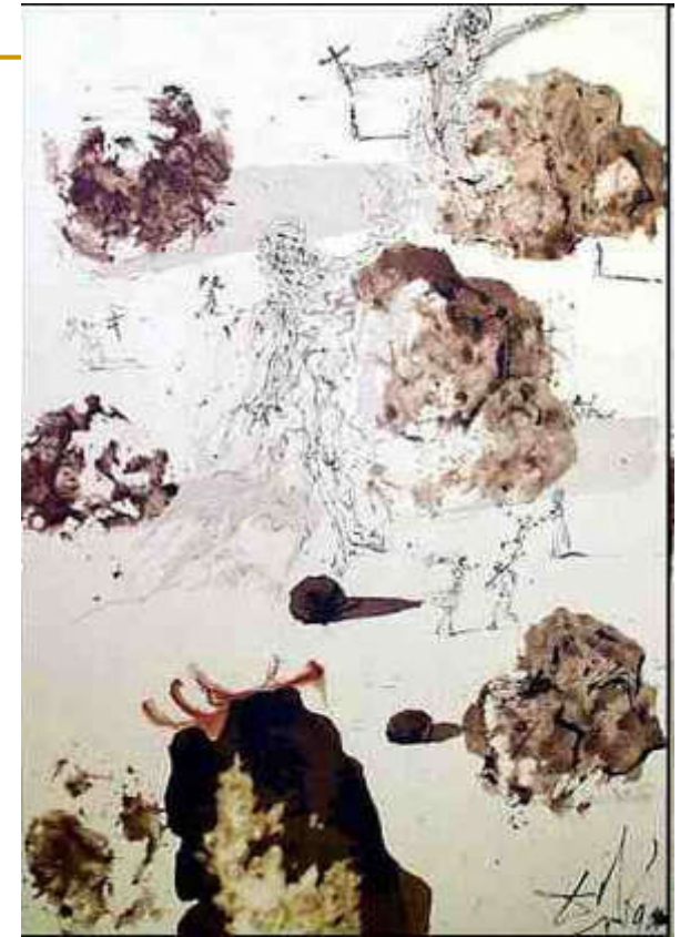
S. Dali, Omnes gentes in valle Josaphat Joel 3,21 (LXX), Biblia Sacra