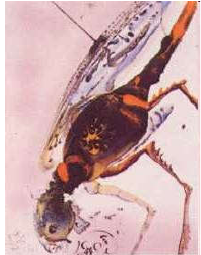
S. Dalí, Locusta et bruchus, Biblia Sacra 1964-67