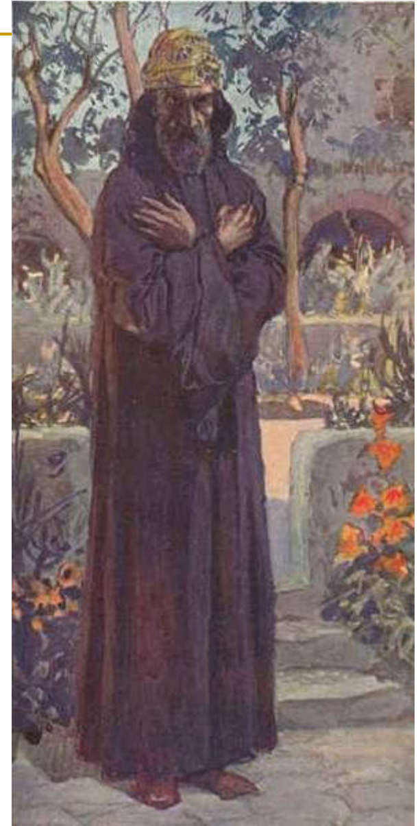
James Tissot, Prorok Joel