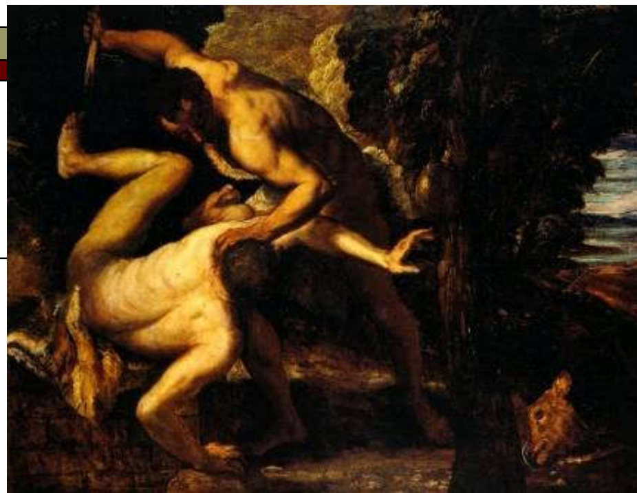
Tintoretto 1518 – 1594, Kajin i Abel; Ulje na platnu (149 × 196 cm) — 1550-53