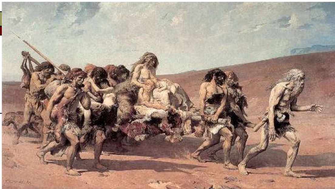
Fernand Cormon (1880), Kajin u zemlji Nod, Paris