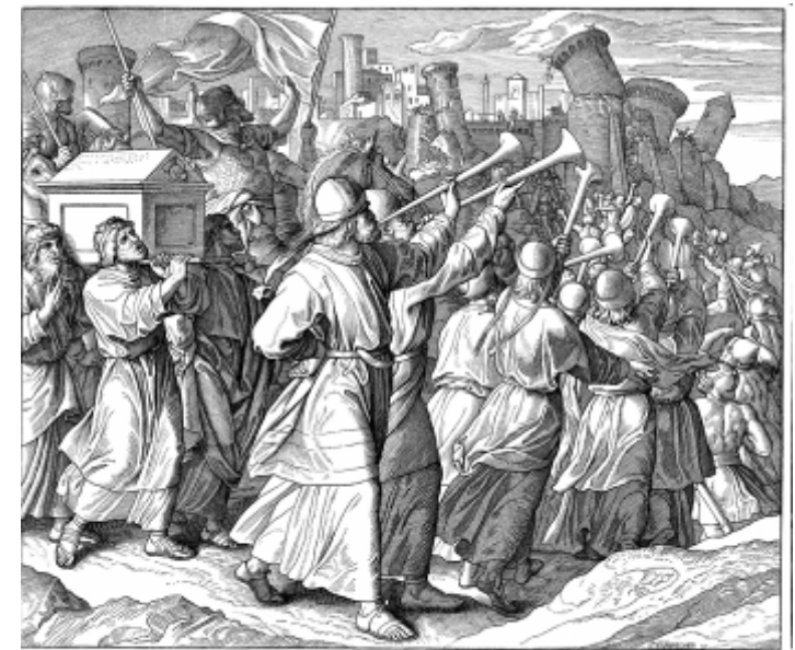
Stricke mich erobert und zerstört. Es mehrte hat Gott die Hebräer, und hieß sie Jericho. Von alt hat Gott den Hebräer hiezu, mehrte die gott Hebräer. Hat die Hebräer habe sie, und hat Gott erobert die Stadt, die Jericho hieß sie Jš. von Schn. 1851-60.

Julius Schnorr von Carolsfeld, Osvajanje Jerihona (1851-60) „Bibel in Bildern“.