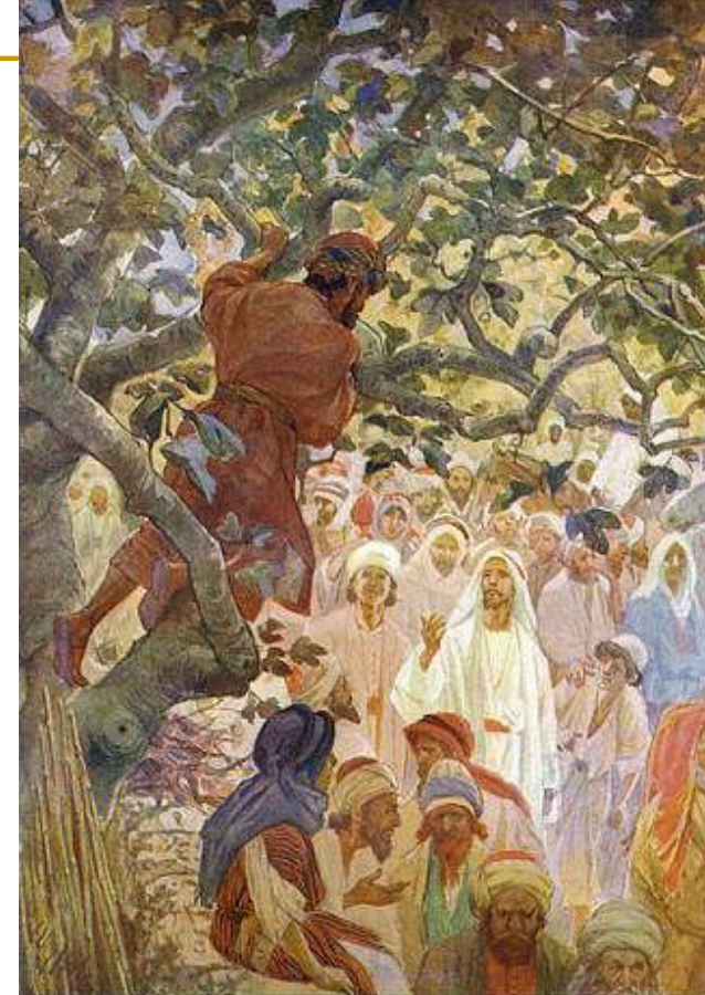
Zacchaeus In The Sycamore Tree by William Hole