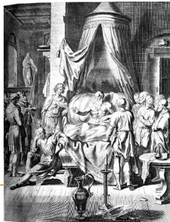
Matthias Scheits, Jakov blagoslivlja sinove, 1672.