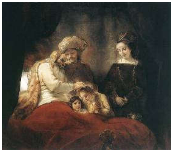
Rembrandt, Jakov blagoslivlja Josipove sinove, 1656