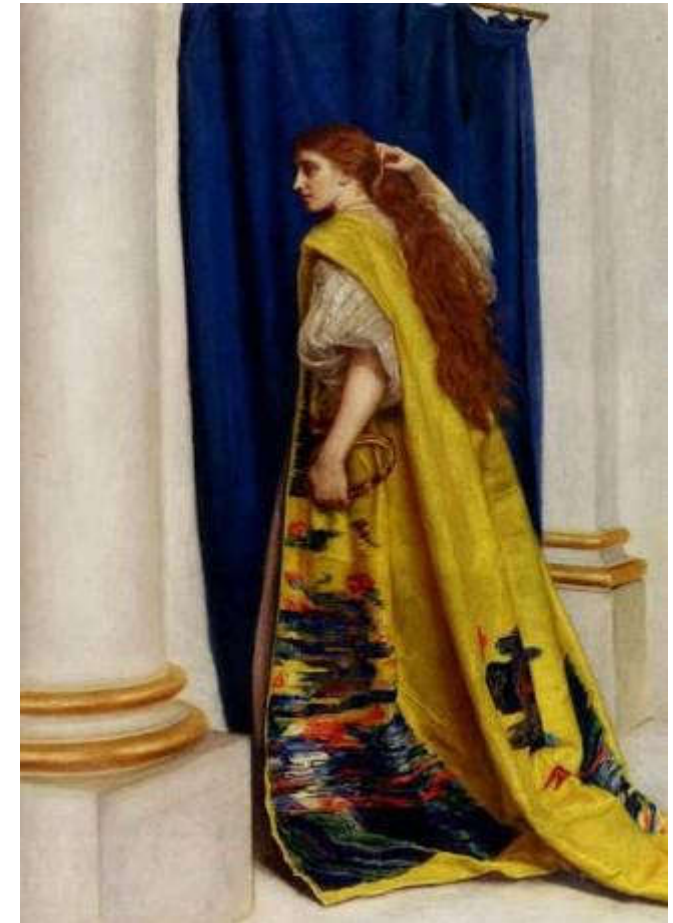
Sir John Everett Millais (1829-96)