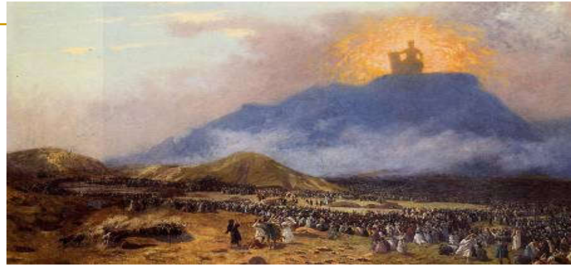
Jean-Léon Gérôme, Mojsije na gori Sinaju (1895-1900)