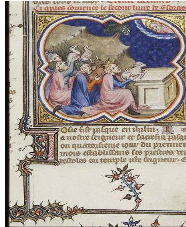
Minijatura, Petrus Comestor, Bible Historiale, Francuska, 1372