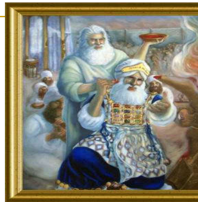
Darlene Slavujac, Mojsije posvećuje Arona, ulje na platnu, 1999.