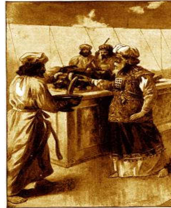
AARON AND HIS SONS PREPARING A BURNT SACRIFICE.—LEV. I. 11.